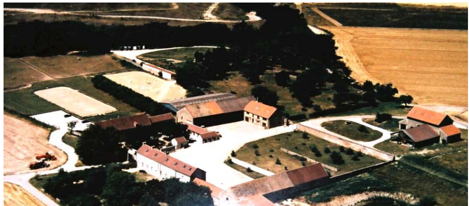
Fig. 4 La collocation des bâtiments dans une ferme francilienne.

les et matériels (hangar et grange), pour la transformation des produits (distillerie des betteraves). Les propriétaires n'habitaient pas souvent dans la ferme mais dans un château auquel la ferme appartenait et qui formait une domaine. Au centre de la ferme, où jadis trônait le tas de fumier, est aménagé un jardin.