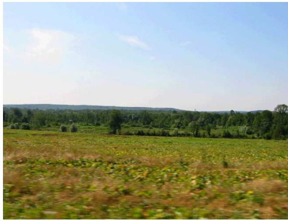
Fig. 2 Les grands espaces de plateaux bordés par les fronts boisés qui descendent vers la vallée

liée à l'élevage et aux cultures spécialisées comme le maraîchage. On y retrouve aussi des grands forêts comme celles de Fontainebleau et de Rambouillet, au cœur des terres agricoles.