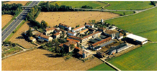
Fig. 3 La collocation des bâtiments dans une ferme milanaise

La ferme francilienne est plus petite, constituée par une dizaine de bâtiments, une résidence où habitent deux ou trois familles, le bâti pour l'élevage (étable, bergerie, écurie), pour le stockage des céréa-