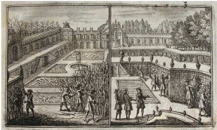
Gravure extraite des Instructions pour les jardins fruitiers et potagers (1960) de La Quintinie