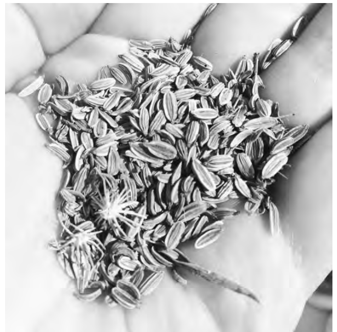
Cueilleuses de paysages

Les cueilleuses de paysage : visite thématique sur les plantes médicinales et aromatiques