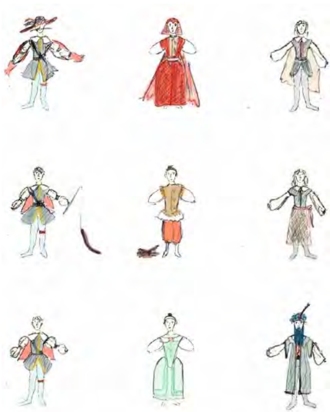
maquettes des costumes

Spectacle autour des contes de Perrault, par la compagnie Oghma.